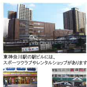
東神奈川駅の駅ビルには、スポーツクラブやレンタルショップがあります。 ミスタードーナツ マルエツ