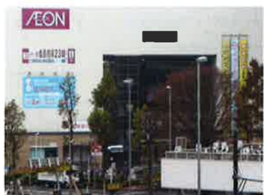
セベレンス館から徒歩2分(130m)にイオンがあります。

最寄のJR東神奈川駅からわずか徒歩2分の好立地。周辺にはスーパーはもちろん、病院や郵便局など、生活に欠かせない施設が揃っています。