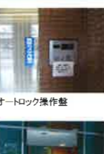
オートロック操作盤