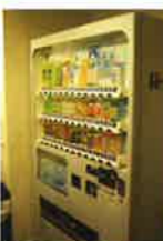
ラウンジ 自動販売機