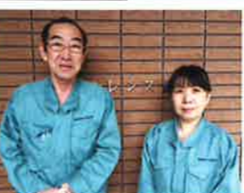
管理人夫婦は、セベレンス館に住み込み。学校から帰ってくる寮生を温かく迎えてくれます。