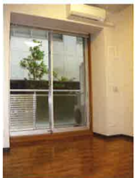
フロアリング調クッションフロア