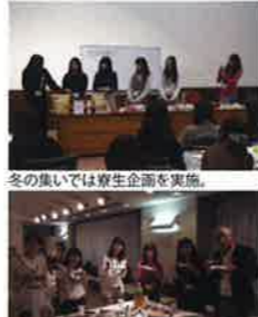
学校の先生も交え、楽しい会食。