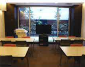
ラウンジを貸切ってパーティーをすることも可能。