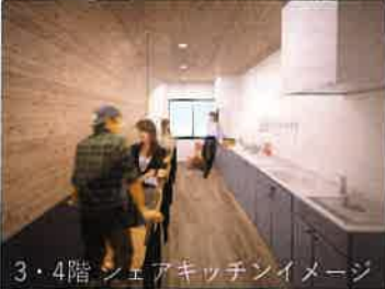
3・4階 シェアキッチンイメージ