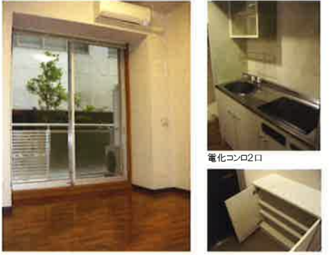
フローリング調クッションフロア シューズボックス