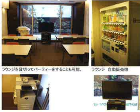
ラウンジを貸切ってパーティーを楽しむことも可能。 ラウンジ 自動販売機 ラウンジ テレビ