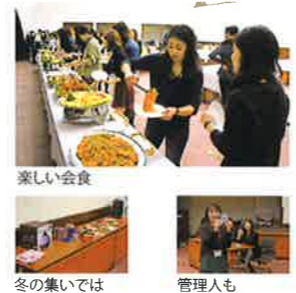
楽しい会食 冬の集いでは寮生企画実施 管理人も寮生の集いに参加