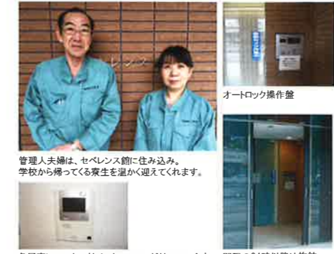
管理人夫婦は、セベレンス館に住み込み。学校から帰ってくる寮生を温かく迎えてくれます。 オートロック操作盤 各居室にモニター付インターフォンが付いています。門限の24時以降は施錠。

🚗 >> 横浜キャンパスまで約19分※1、白金キャンパスまで約30分※2。両キャンパスへ通学可能です。