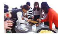
たこ焼きパーティー