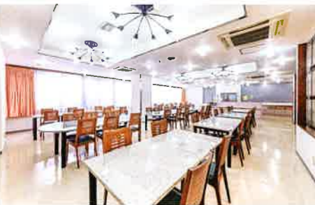
ダイニングルーム

栄養士がきちんと栄養バランスを考えて献立を作っています。朝食は和食・洋食どちらでも選択でき、ご飯・お味噌汁はおかわり自由です。