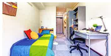
プライベート重視の個室

設備 学生寮ならではの便利な設備や、コミュニケーションの場となる共用設備が充実。