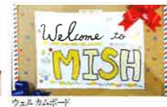
ウェルカムボード