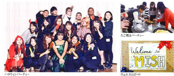
ハロウィンパーティー

学生寮に入居している皆さんと交流を深め、さらに快適に学生寮を楽しんでいただくために様々な国際交流イベントを行っています。